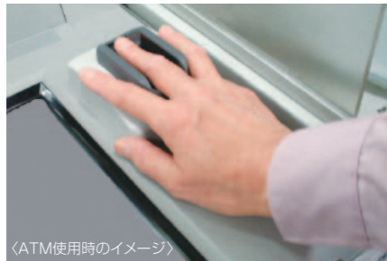
〈ATM使用時のイメージ〉

預金不正払戻防止対策として、「ICキャッシュカード」、および指静脈パターンにより本人認証を行う「 生体認証ICキャッシュカード 」を発行しております。