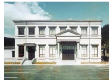
創業50周年「但陽会館」新築