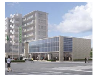
[平成22年11月 城西支店開設予定]