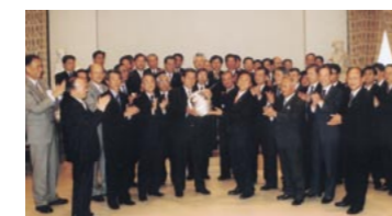
預金総額5,000億円達成