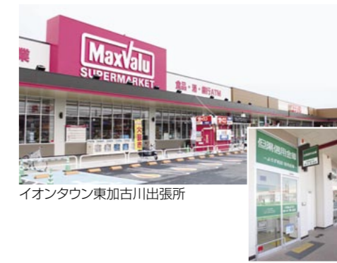
イオンタウン東加古川出張所