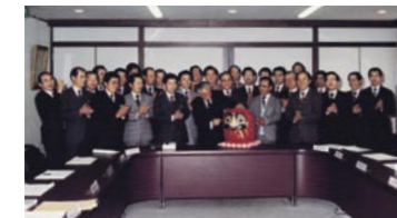
預金総額1,000億円達成