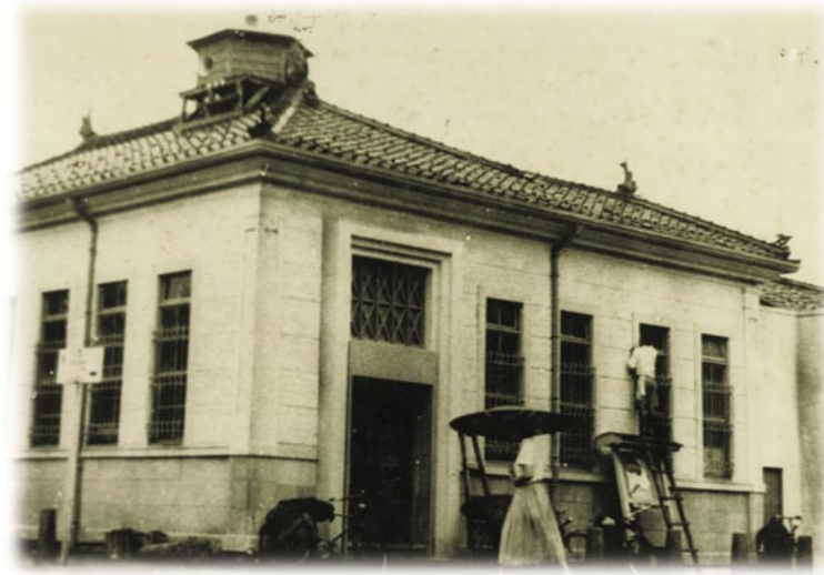
創業当時の生野信用組合