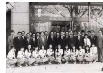
本店を生野町から加古川市へ移転