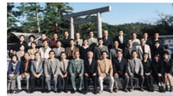
預金総額3,000億円達成記念旅行