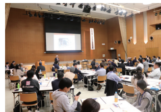
【ワクワク系実践講座】

今年度は、「ワクワク系」入門講演に続く実践講座（2023年4月～10月にかけて4回コース）を対面にて開催、当金庫の渉外担当者が実践講座に同席するとともに、その後も参加事業者様を継続して訪問し伴走支援に努めています。