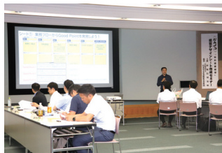
【経営デザインシート作成支援セミナー】

今年度は5月に「加古川」「朝来」、9月に「姫路」「神崎」で「知的資産経営支援セミナー」を対面で開催。また、知的資産経営に取り組む第一歩となる「経営デザインシート作成セミナー」では、当金庫の支店長及び渉外担当者が参加事業所の伴走支援を担っています。