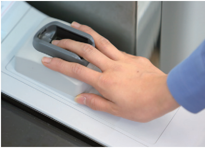
〈生体認証ICキャッシュカード使用時のイメージ〉