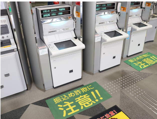
振り込め詐欺被害防止用マット「フロアサインシート」

また、2015年6月15日より、兵庫県警察本部と連携し、「預金小切手を活用した特殊詐欺被害防止対策(通称:預手プラン)」を実施しています。