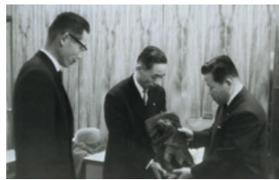
姫路支店開店時(昭和41年3月)