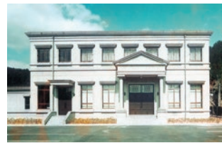
創業50周年「但陽会館」新築(昭和50年12月)