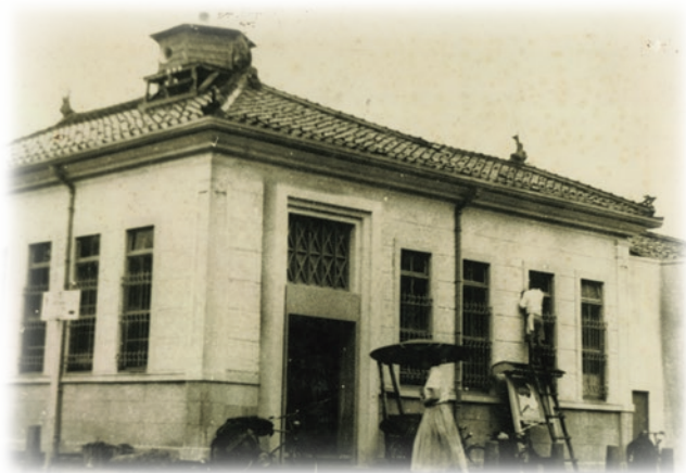
創業当時の生野信用組合