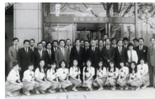
本店を生野町から加古川市へ移転(昭和63年5月)