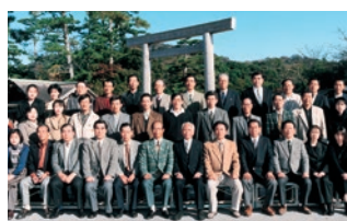
預金総額3,000億円達成記念旅行(平成8年11月)