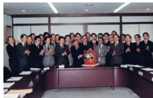
預金総額1,000億円達成(昭和57年12月)