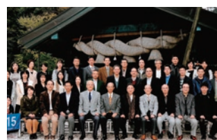
預金総額7,000億円達成記念旅行(平成28年11月)